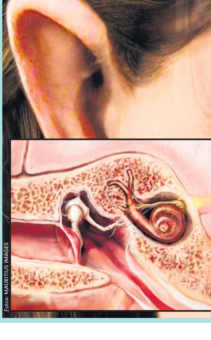
Im Ohr leiten die Gehörknöchelchen (Steigbügel, Amboß und Hammer, von re. neben der Schnecke) die mechanischen Schwingungen von Tönen auf das Trommelfell

Schwerpunkte: Ambulante Operationen bei Kindern, stationäre Operationen, Allergologie, Tinnitusbehandlung, Schwindelabklärung. Kroonhorst 11, 22549 Hamburg ☎ 832 01 01